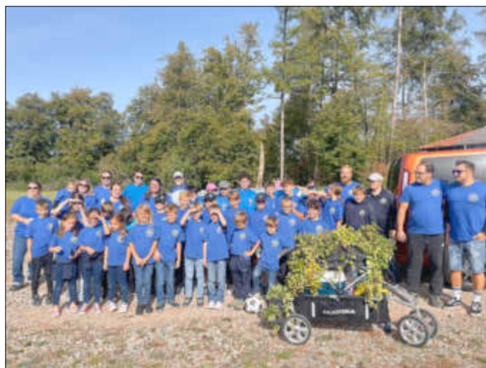
Die Teilnehmer der JSG Freisen beim Erntedank in Rückweiler

Die Kicker verteilten zahlreiche Süßigkeiten und das Betreuersteam sorgte mit leckeren Likören auch bei den erwachsenen Besuchern für strahlende Augen am Wegesrand. Der FC Heide Rückweiler bedankte sich auch bei der JSG Leitung für die Teilnahme, da deren Mitglieder in diesem Jahr selbst nicht mitgehen konnten und so war der Fußball trotzdem vertreten!