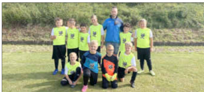
E-Jugend in Stennweiler

Am Samstag, den 07.10., waren die Kicker der E2 in Stennweiler zu einem Freundschaftsspiel eingeladen. Vor Ort mussten wir feststellen, dass wir gegen die 1. Mannschaft des Gastgebers anzutreten hatten. Allerdings ließen die Kicker der JSG sich das nicht anmerken und versuchten gleich den Gegner zu attackieren. Leider gelang dies nur kurz. Die Gastgeber waren meistens einen Schritt schneller und die eigene Abwehr rückte nie schnell genug raus. Nichts desto trotz gab keiner der JSG Kicker sich auf und bis zum Ende kämpfte man sich immer mal wieder nach vorne durch und gegen eine deutlich stärkere Mannschaft auf Stennweiler musste man sich am Ende mit 3:12 geschlagen geben. Aber die Kicker werden auch aus dieser Partie das Positive mitnehmen und das waren die drei toll herausgespielten Tore!